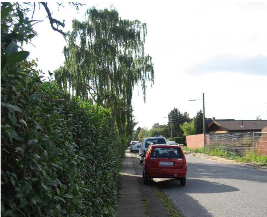
Krebsevej set fra øst mod vest. Til højre i billedet ses skellet ind til lokalplanområdet – indhegnet med trådhegn

Lokalplanområdet ligger tæt på natur og grønne områder. Ca. 100 meter mod vest ad Krebsevej ligger et grønt anlæg, hvorfra der er sti-