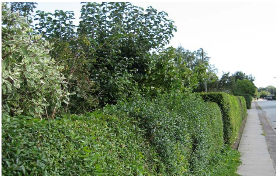
Strandholms Allé set fra nord mod syd

Bebyggelsen i området består primært af parcelhuse opført i blank mur, røde eller gule mursten og med sadeltag beklædt med sort eter- nit eller betontegl. Boligområdet er karakteriseret ved, at boligerne er "gemt" inde bag høje hække, hvilket tilfører området et grønt præg.