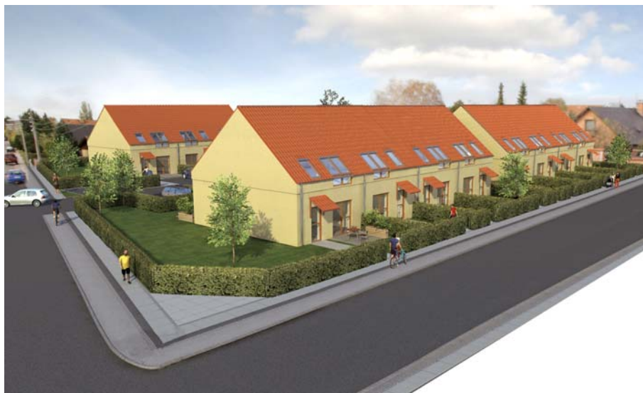
Visualiseringer af ny rækkehusbebyggelse v. Danaform Arkitektfirma ApS.

Danaform Arkitektfirma ApS har for ejeren udarbejdet et skitseprojekt til ny rækkehusbebyggelse, som i princippet er i overensstemmelse med lokalplanens bestemmelser om bebyggelsens omfang, placering og ydre fremtræden.