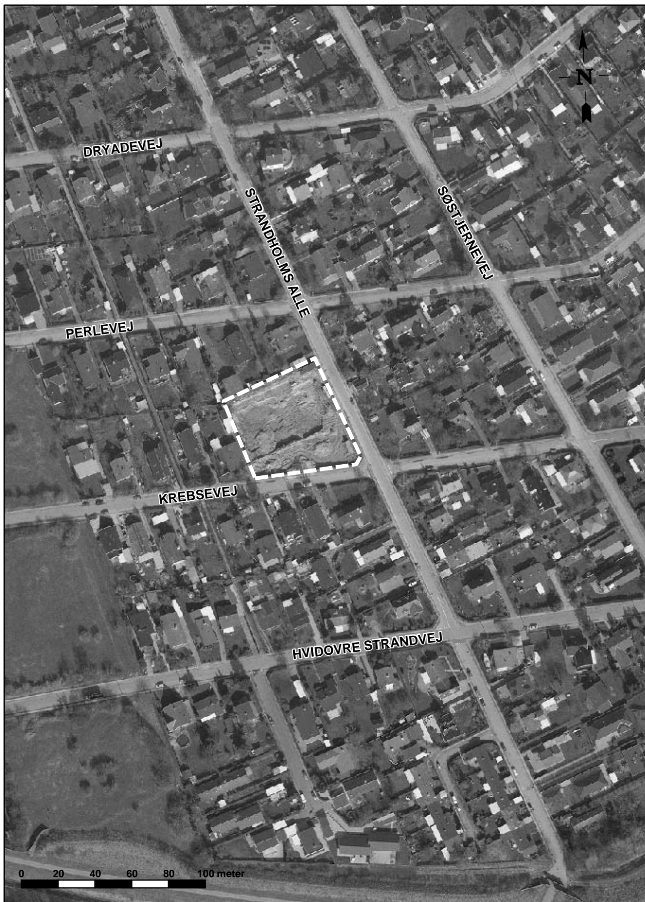
Luftfoto af lokalplanområdet, fotograferet i marts 2007.